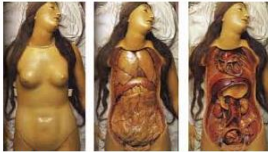
Clemente Susini: Venus de los médicos (1781-1782). Museo Zoológico de la Specola. Florencia.