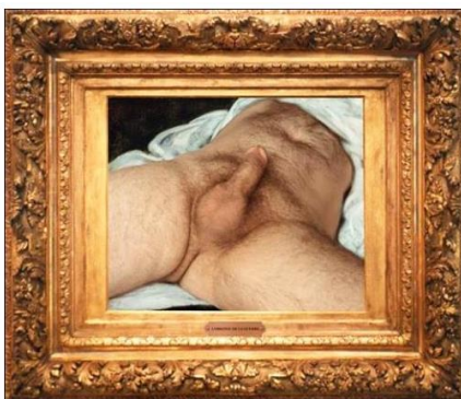
"L'origine de la guerre" (El origen de la Guerra) Orlan 1989.