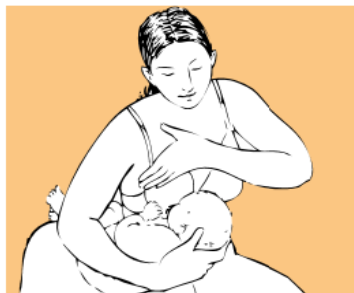
Canasta (pelota) simple.