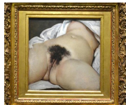
"L'origine du monde" (El origen del mundo) Gustave Courbet 1866