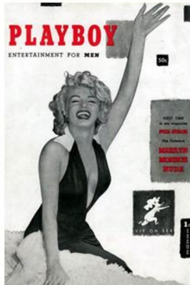
Portada de Playboy (Marilyn Monroe). Primera edición, diciembre de 1953. (53.991 revistas)